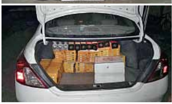
મેન્દ્રા ચોકડી પાસેથી દારૂ ભરેલી બે કાર ઝડપાઈ હતી.